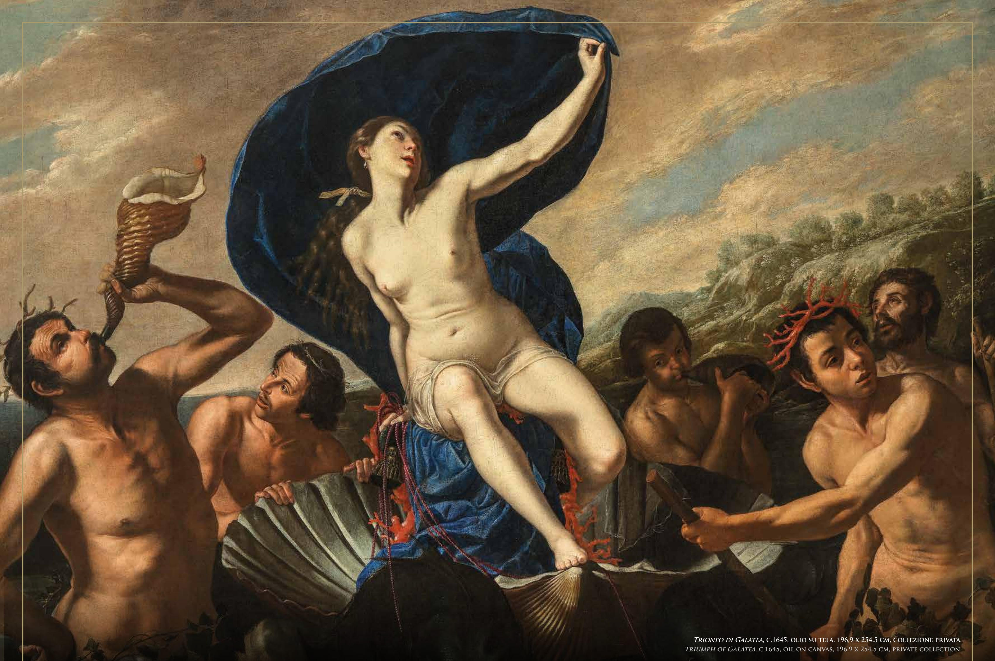
TRIONFO DI GALATEA, C.1645, OLIO SU TELA, 196,9 X 254,5 CM, COLLEZIONE PRIVATA. TRIUMPH OF GALATEA, C.1645, OIL ON CANVAS, 196.9 X 254.5 CM, PRIVATE COLLECTION.