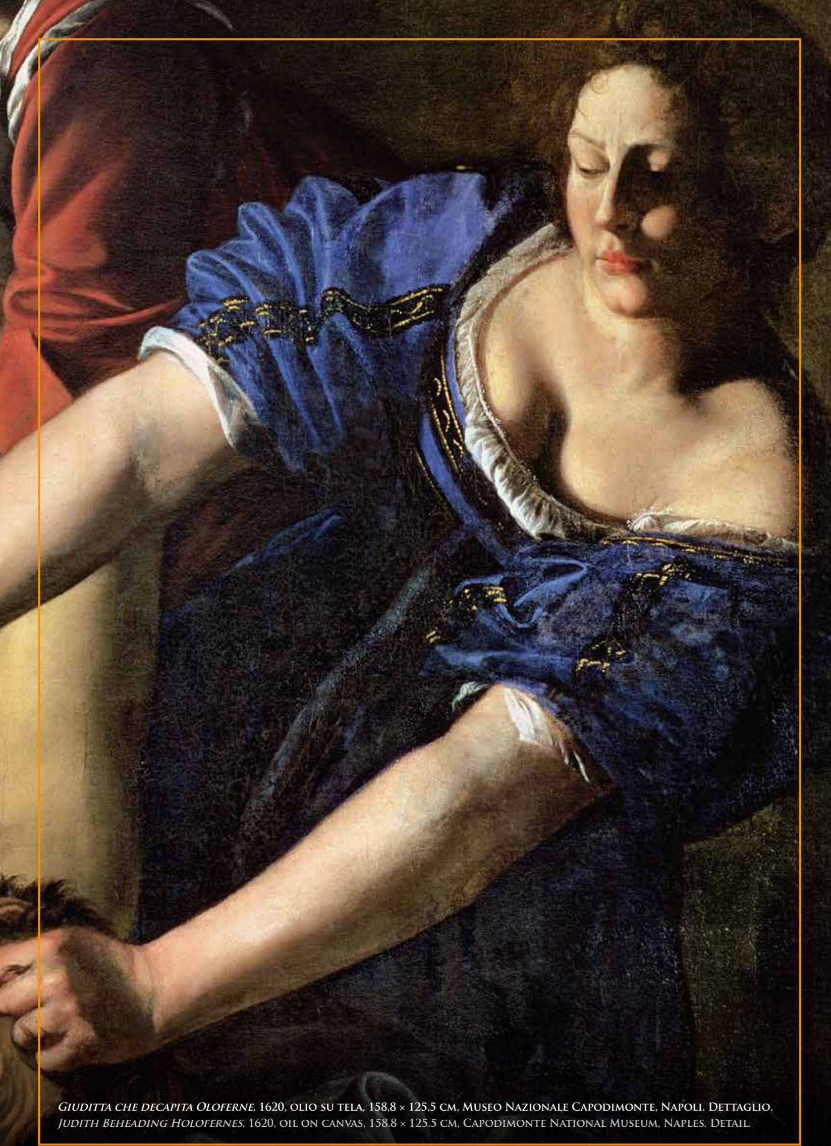
GIUDITTA CHE DECAPITA OLOFERNE, 1620, OLIO SU TELA, 158,8 x 125,5 CM. MUSEO NAZIONALE CAPODIMONTE, NAPOLI. DETTAGLIO. JUDITH BEHEADING HOLOFERNES, 1620, OIL ON CANVAS, 158.8 x 125.5 CM. CAPODIMONTE NATIONAL MUSEUM, NAPLES. DETAIL.