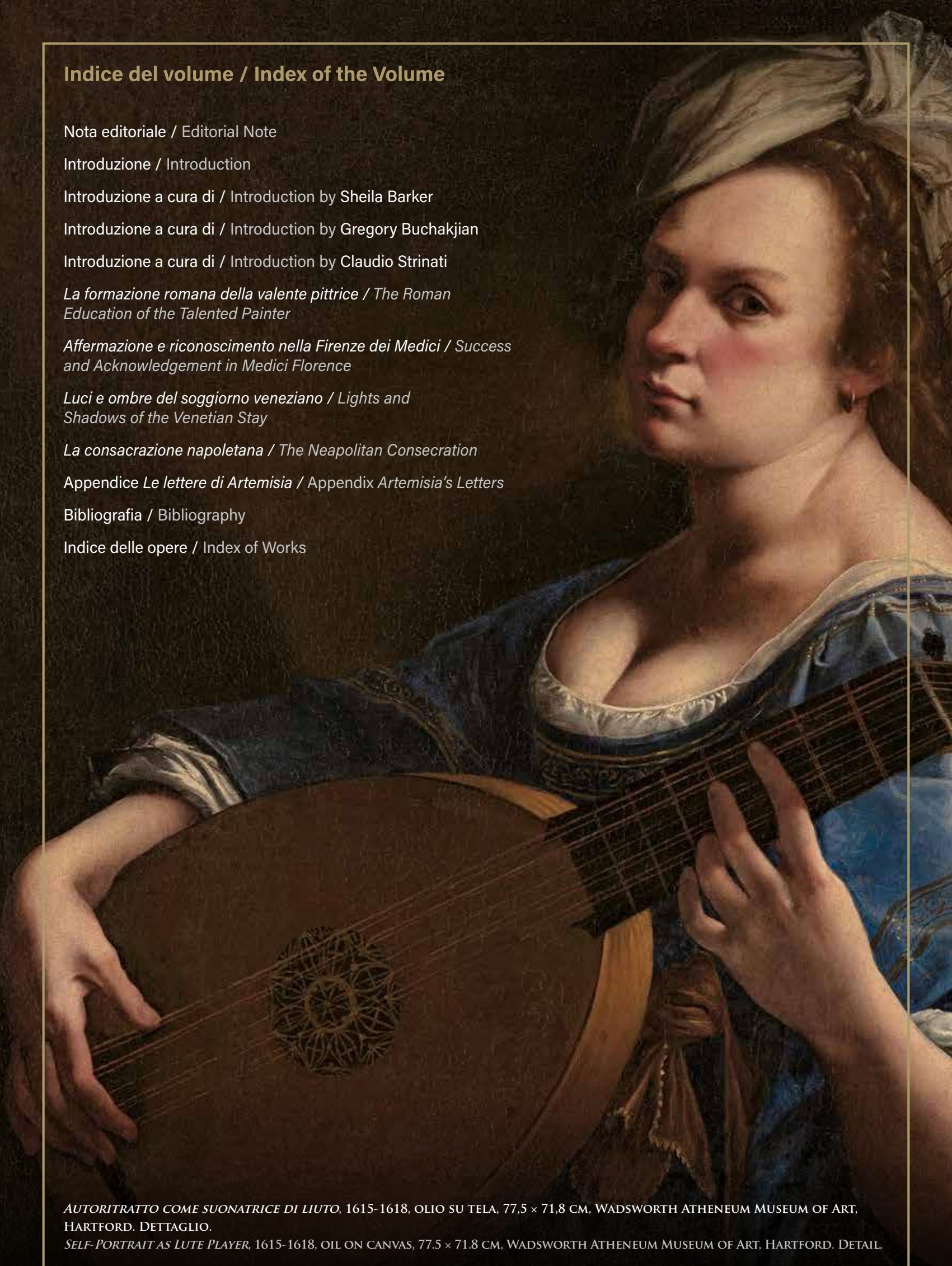
AUTORITRATTO COME SUONATRICE DI LIUTO, 1615-1618, OLIO SU TELA, 77,5 × 71,8 CM, WADSWORTH ATHENEUM MUSEUM OF ART, HARTFORD. DETTAGLIO. SELF-PORTRAIT AS LUTE PLAYER, 1615-1618, OIL ON CANVAS, 77.5 × 71.8 CM, WADSWORTH ATHENEUM MUSEUM OF ART, HARTFORD. DETAIL.