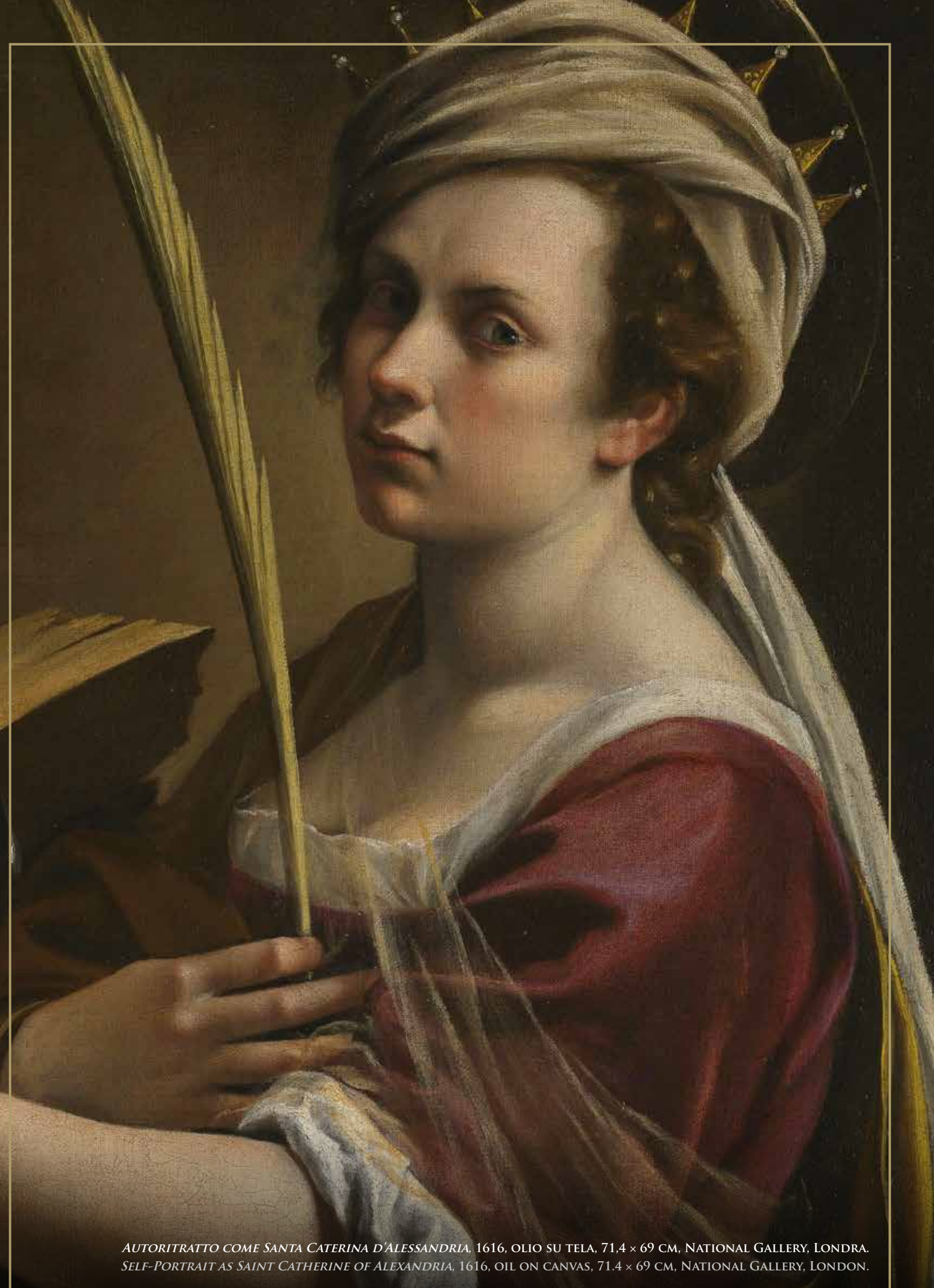
AUTORITRATTO COME SANTA CATERINA D'ALESSANDRIA, 1616, OLIO SU TELA, 71,4 × 69 CM, NATIONAL GALLERY, LONDRA. SELF-PORTRAIT AS SAINT CATHERINE OF ALEXANDRIA, 1616, OIL ON CANVAS, 71.4 × 69 CM, NATIONAL GALLERY, LONDON.